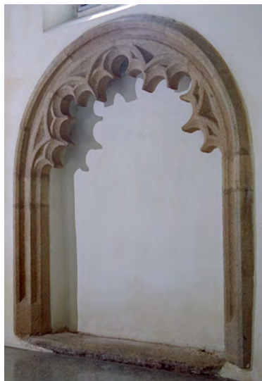
74 Olbramkostel, kostel Nanebevzetí P. Marie, sedile. 3. čtvrt. 14. stol.