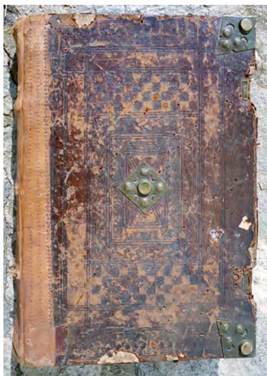
76 Olbramkostel, kostel Nanebevzetí P. Marie, vazba Olomouckého misálu. Před 1509