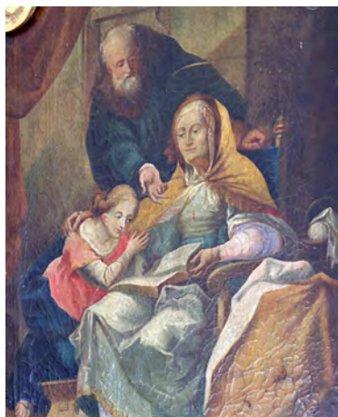
75 Olbramkostel, kostel Nanebevzetí P. Marie, Vyučování P. Marie. Konec 18. stol.