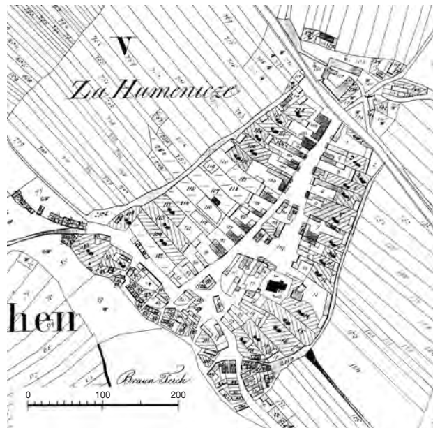
13 Olbramkostel, půdorys městečka podle měření stabilního katastru r. 1824

FARA (čp. 13) – z 2. čtvrt. 18. stol. s následujícími úpravami (interiér, fasády). – Volně stojící jednopatrová budova na obdél. půdorysu s mansardovou střechou. Fasádu člení kordonová římsa, na nárožích pásová rustika, v patře rámu-