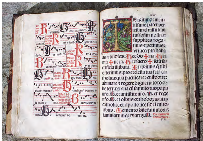
77 Olbramkostel, kostel Nanebevzetí P. Marie, Olomoucký misál. 1505, tisk Johann Winterburger, Vídeň, fol. CLXV-v – CLXVI-r s iniciálou T-e