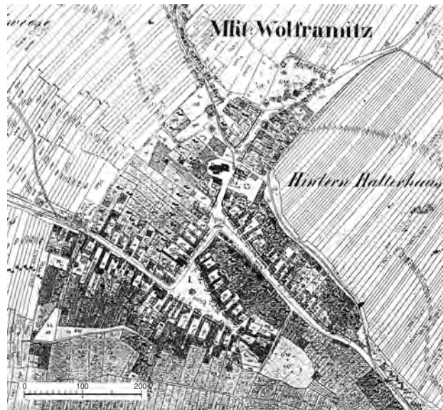
15 Olbramovice, půdorys městečka podle měření stabilního katastru r. 1825

Městečko vývojového typu na rovinatém terénu pod jv. výběžky Krumlovského lesa, zabíhajícími do Dyjsko-svrateckého úvalu při prameni Olbramovického potoka (pravobřežní přítok Mlýnské strouhy ústící do Dyje). V nesourodém půdorysu sídliště (odrážejí se v něm někdejší samostatná sídliště), jehož zákl. osnova se utvářela při průběžné komunikaci směřující od Moravského Krumlova již. směrem (Branšovice – Vlasatice – povodí Dyje) lze hist. jádro pův.