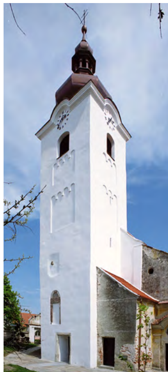
69 Olbramkostel, kostel Nanebevzetí P. Marie, věž. Před 1230? – 1719?, zastřešení 1921