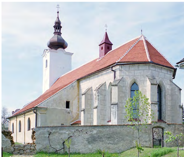
68 Olbramkostel, kostel Nanebevzetí P. Marie. Před r. 1230? – 20. stol.