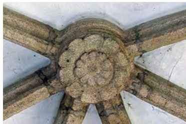
73 Olbramkostel, kostel Nanebevzetí P. Marie, svorník klenby v závěru kněžiště. 3. čtvrt. 14. stol.