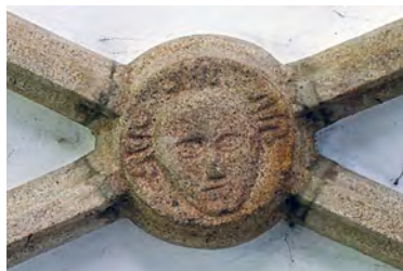
72 Olbramkostel, kostel Nanebevzetí P. Marie, svorník klenby prostředního klenebního pole kněžiště. 3. čtvrt. 14. stol.