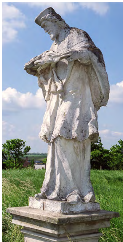
78 Olbramkostel, sv. Jan Nepomucký. 1747